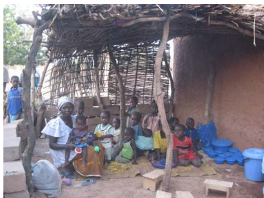
In Nangho Fulcé is een mobiele crèche