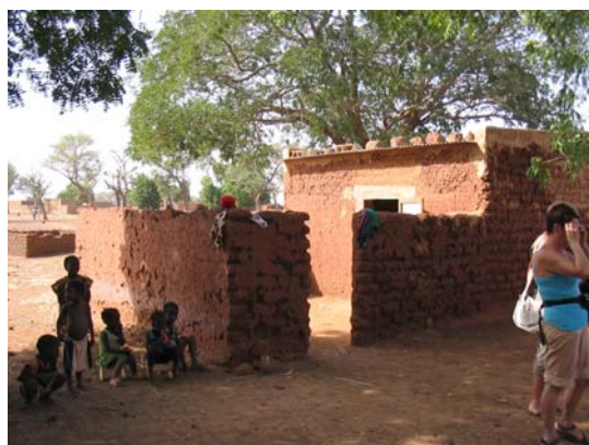
De permanente crèche in Nimpouya

Verschillende dorpen met een crèche zijn tijdens het bezoek aan Burkina Faso door de WOL delegatie bezocht.