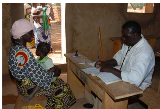
Aan het begin en einde van een cursus worden alle kinderen medisch onderzocht