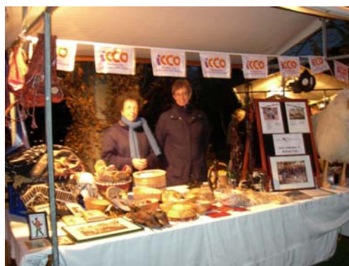
Kerstmarkt Castricum: Verkoop van kunstnijverheid uit Burkina Faso en informatie over de projecten.