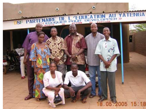
Het team van DSF

Als mede-oprichter van DSF is de WOL er zeer trots op dat DSF is uitgegroeid tot een volwassen en volwaardige organisatie die participeert en functioneert op alle niveaus van beleidsvorming en beleidsvoering op het gebied van onderwijs in Burkina Faso. De projecten van DSF maken deel uit van het nationale programma van het ministerie van basisonderwijs en alfabetisering in Burkina Faso en het mondiale programma 'Education For All' van de Verenigde Naties / UNESCO. Deze programma's