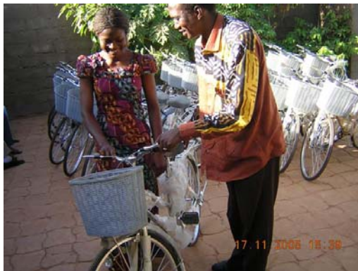
Fietsen voor scholieren

In september 2003 is gestart met het Scholieren Adoptie Project (SAP). Voor € 350,- per jaar sponsoren 'adoptie'-ouders in Nederland een scholier in Burkina Faso. Het gaat om kansarme dorpskinderen die anders geen vervolgonderwijs kunnen volgen. De adoptieouders ontvangen een foto van het kind en jaarlijks een brief. In het schooljaar 2004-2005 namen 18 scholieren aan het project deel. Begin 2005 ontvingen we het trieste bericht dat een van de kinderen was overleden aan een onbekende ziekte. Twee meisjes zijn zwanger geraakt en in juli en september bevallen. DSF heeft er voor kunnen zorgen dat deze meiden na de bevalling weer terug konden keren naar school, wat heel ongebruikelijk is. De kosten voor babyvoeding worden door de WOL gefinancierd. In het schooljaar 2005-2006 is het aantal deelnemende scholieren gegroeid tot 23, 11 jongens en