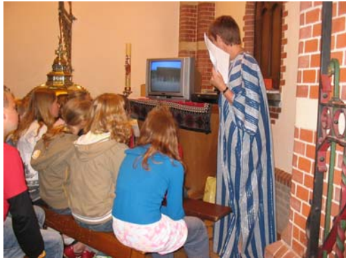
Nederlandse kinderen kijken naar de film van de scholen in Burkina Faso

scholen in Burkina die naar het kantoor van DSF waren gehaald om via de computer met hun leeftijdgenoten in Nederland te chatten. In Nederland waren vertalers aanwezig voor de communicatie in het Frans.