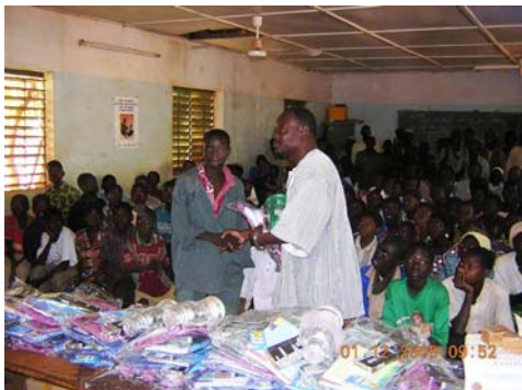
Prijzuitreiking voor de winnaars van de tekenwedstrijd over kinderrechten

Dit programma heeft als doel de rechten van kinderen op het platteland te beschermen. Het gaat hierbij niet alleen om het recht op onderwijs, maar ook om het recht op bescherming en lichamelijke integriteit, tegengaan van de besnijdenis van meisje, uitbuiting van kinderen, kinderhandel, verwaarlozing, etc. DSF werkt in dit programma samen met de Burkinese mensenrechtenorganisatie MBDHP. Met theatervoorstellingen gaat men de dorpen langs om de bevolking bewust te maken van de rechten van het kind. Verschillende radio-uitzendingen zijn over deze onderwerpen verzorgd. Met mobiele videoapparatuur gaan medewerkers van DSF de scholen langs om films