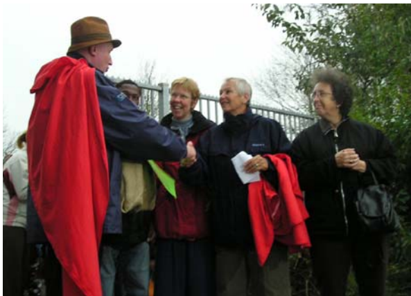
Wethouder Könst overhandigt een cheque van € 500,- aan een delegatie van de WOL tijdens de opening van de vernieuwde Sint Maartenschool

Vier basisscholen in de provincie Noord Holland zijn betrokken bij de projecten van de WOL en DSF: de Pax Christischool en de Sint Maartenschool in Limmen, de Sokkerwei in Castricum en de Uilenburchtschool in Grootebroek. Zij hebben contact met 4 basisscholen in de provincie Yatenga in Burkina Faso. Jaarlijks vindt er een uitwisseling plaats tussen de scholen. Dit jaar hebben 2 Nederlandse scholen (Pax Christischool en Sint Maartenschool) en 2 scholen in Burkina (De school in Nimpouya en in Tougué-Mossi) een film en fotoreportage gemaakt over hun school. De film uit BF is voor de groepen 6-7-8 van de Limmer scholen vertoond als onderdeel van een educatief project over het onderwijs in Burkina Faso. Op de Sokkerwei is de film vertoond tijdens een gastles. De film over de Limmer scholen is tijdens een culturele week in mei vertoond aan de kinderen en hun ouders in Burkina Faso. De kinderen in Nederland en Burkina hebben getekend