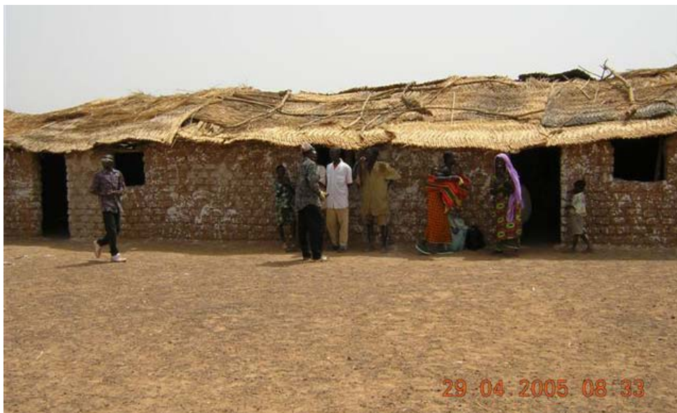
Sommige scholen zijn niet meer dan een hut van leem en stro.