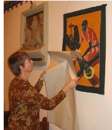
Onthulling van de staties in de Corneliuskerk

In de hervormde kerk was er 7 november een dienst met aandacht voor de projecten in Burkina.