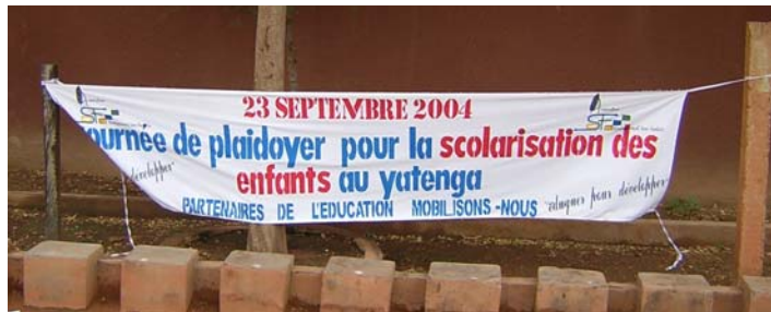
Mobilisatie van gezagsdragers om alle kinderen naar school te laten gaan

alfabetisering van de bevolking. Tot deze gezagsdragers behoren: de Hoge Commissaris van Yatenga, de (traditionele) koning van Yatenga, de Groot Iman van Ouahigouya, de Bisschop van Yatenga, Protestantse kerkleiders van Ouahigouya, de prefecten (burgemeesters) van de districten, de voorzitters van de ouderverenigingen van de DSF scholen, de regionale en provinciale directies voor het basisonderwijs en de alfabetisering in de regio Noord van Burkina Faso (4 provincies), de hoofdinspecteurs van het onderwijs in Yatenga. Tijdens een congres, georganiseerd door DSF, beloofden alle gezagsdrager zich in te spannen om in hun werkgebied er voor te pleiten dat ouders hun kinderen massaal inschrijven op een school.