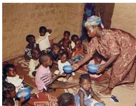
In de crèche een gezonde maaltijd

De crèches bleken een groot succes: het percentage moeders dat met succes de cursus heeft afgesloten is van 66% in 2003 gestegen naar 95% in 2004. Er waren nauwelijks moeders die de cursus voortijdig beëindigden en er werd nauwelijks verzuimd. De crèches hebben nog een ander positief effect: de leidsters hebben een training gehad om de zorg voor en het welzijn van de kinderen te bevorderen. Dagelijks werd er voor de kinderen een voedzame maaltijd bereid en maandelijks werden de kinderen gecontroleerd door een gezondheidswerker. In de crèche werden de kinderen gestimuleerd in hun ontwikkeling door het doen van activiteiten en het aanbieden van