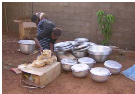
Nieuwe pannen voor de schoolkantines

In november 2003 is een begin gemaakt met de uitvoering van het project 'Onderwijs en Voedselzekerheid'. In 5 dorpen zijn ouders begonnen met een alfabetiseringscursus en een training ter verbetering van de landbouwmethoden. In 2004 is het project uitgebreid met de opzet van crèches voor de kinderen van deelnemende moeders aan de cursus, de aankoop van landbouwgereedschap en het opzetten van schoolkantines. Het is de bedoeling dat door meer kennis van betere landbouwmethoden en het beschikbaar stellen van landbouwgereedschap de voedselproductie wordt opgevoerd. Ouders mogen het landbouwgereedschap gebruiken in ruil voor een deel van de oogst waarmee de crèches en schoolkantines van voedsel worden voorzien. Helaas was het regenseizoen 2004 uitermate slecht. De ouders hebben nog minder kunnen oogsten dan het jaar ervoor. Wel hebben zij zelf een inkoop- en distributiesysteem op kunnen zetten voor graan. Dank zij de alfabetisering hebben zij vaardigheden ontwikkeld om zich te organiseren en zijn zij zich bewust geworden van redelijke marktprijzen voor voedsel. Hierdoor worden zij niet meer afgezet door malafide handelaren.