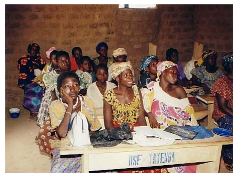
Ouders in de schoolbanken

Ouders zijn alleen gemotiveerd om hun kinderen naar school te sturen als ze zelf de voordelen van onderwijs ervaren hebben. DSF organiseert daarom alfabetiseringscursussen voor volwassenen, zodat zij hun kinderen gaan inschrijven op een school en de kinderen bij hun schoolloopbaan kunnen begeleiden. De alfabetisering bestaat uit een driedelige basis cursus waarin rekenen en lezen en schrijven in het Mooré geleerd wordt en een aanvullende cursus over specifieke onderwerpen als hygiëne, gezondheidszorg, milieu en landbouwtechnieken. Eventueel kan nog een vijfde cursus gevolgd worden waarin het spreken, lezen en schrijven in het Frans geleerd wordt. Gealfabetiseerde volwassenen worden ingezet en verder getraind voor het functioneren in ouderraden, het ondersteunen van de onderwijzers bij hun taak, het beheer van ontwikkelingsprojecten in het dorp, leiden van gespreksgroepen, leiden van de crèches, etc. Voor vrouwen die actief zijn in vrouwenverenigingen heeft DSF voor identiteitskaarten gezorgd zodat zij vrij kunnen reizen naar bijeenkomsten in de stad en elders in het land.