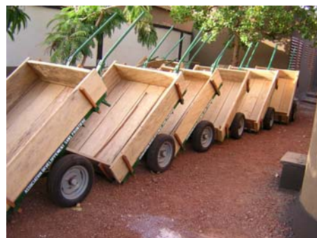
Ezelskarren om op het land te werken