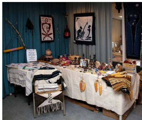
Limmen Creatief: Verkoop van kunstnijverheid uit Burkina Faso en informatie over de projecten.

De WOL maakt van de jaarlijks terugkerende activiteiten in de regio gebruik om zich te presenteren met een informatiestand over de acties en voortgang van de projecten. Folders met informatie over het werk van WOL en DSF worden uitgereikt. Tevens wordt er kunstnijverheid uit Burkina Faso verkocht. In 2004 was de WOL aanwezig met een informatiestand tijdens Limmen Creatief, maart 2004, de jaarmarkt in Limmen, juli 2004, en de kerstmarkt in de Tuin van Kapitein Rommel in Castricum.